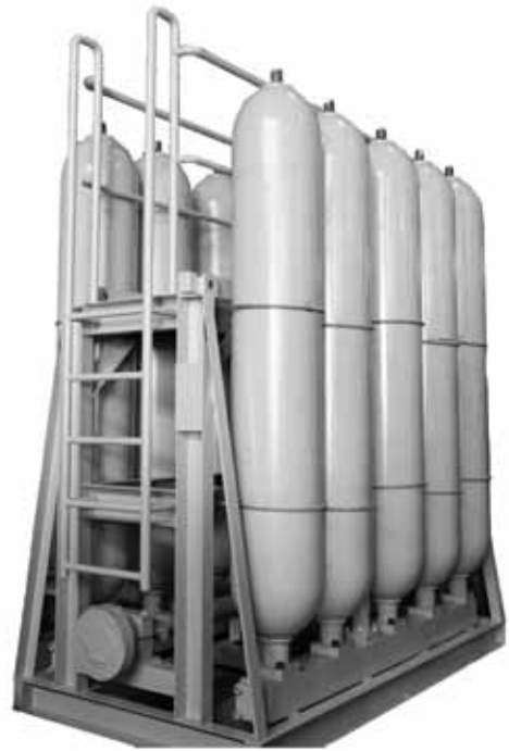
17MPa × 230L × 10本スタンド