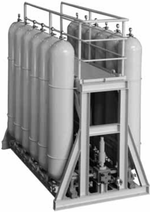
31MPa × 220L × 12本スタンド