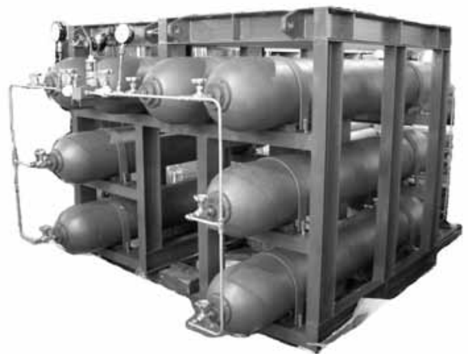
窒素ガス用ガスボトル (特定設備受検品) 20MPa × 155L × 8本スタンド