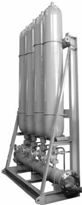
1MPa × 120L × 4本スタンド