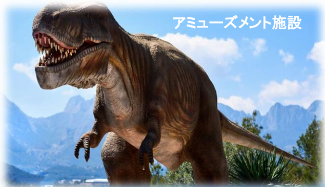
アミューズメント施設