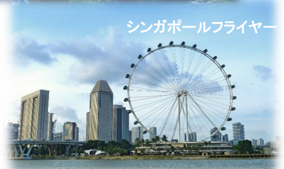
シンガポールフライヤー