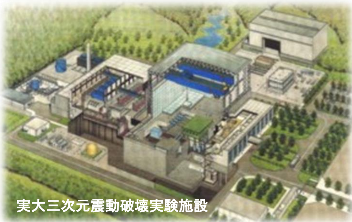
実大三次元震動破壊実験施設